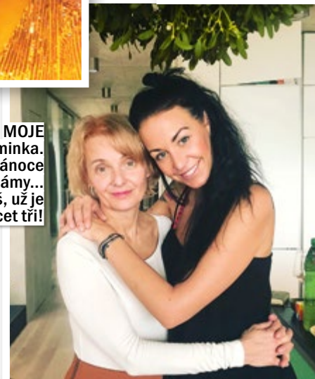
MOJE maminka. A Vánoce bez mámy... Aguš, už je ti třicet tři!