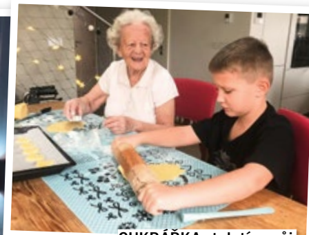
CUKRÁŘKA století a můj vzteklý synek

STORY TEAM vánoční večírek v Bistru Kaprova, kde fakt skvěle vaří