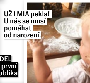
UŽ I MIA pekla! U nás se musí pomáhat od narození.